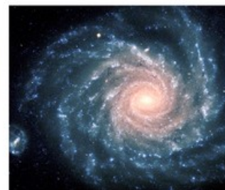
Exemples de champs de torsion du microcosme au macrocosme