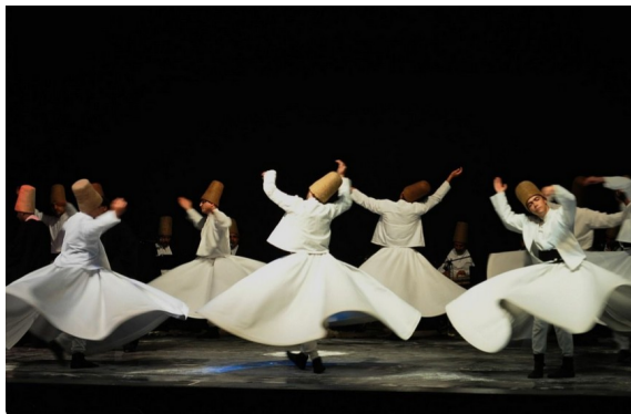
Derviches tourneurs en Iran

D'ailleurs, si plusieurs courants spirituels accompagnent leur travail de conscience de mouvements rotatifs, sans doute est-ce pour renforcer ce mode de réception d'informations.