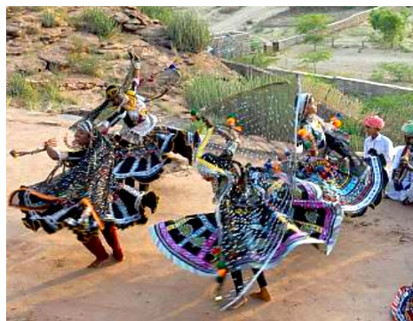
Danse Kalbéla du Rajasthan

La sagesse soufie prétend que celui qui veut "découvrir les mystères de la Création", doit entrer dans des états modifiés de conscience et d'expansion de l'être, par exemple en dansant et tournant sur lui-même – d'où la tradition des derviches tourneurs. Dialogue avec notre Ange n° 39