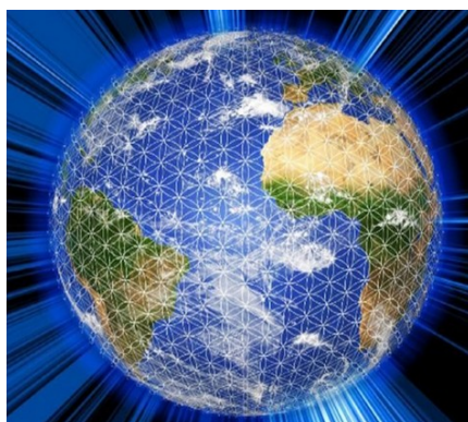
Griglia magnetica del Fiore della Vita secondo Drunvalo Melchizedeck

In altri termini, un individuo che ha riattivato, con l'epigenetica, le informazioni redentrici assopite sin dalla notte dei tempi nel proprio organismo.