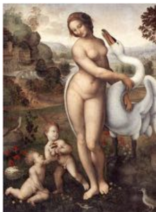
Léda et le cygne de Léonardo Da Vinci